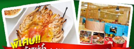
พิเศษ!! กุ้งแม่น้ำ + HOTPOT SEAFOOD