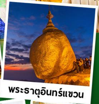
พระธาตุอินทร์แขวน