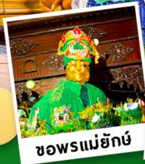
ขอฟรแม่ยักย์